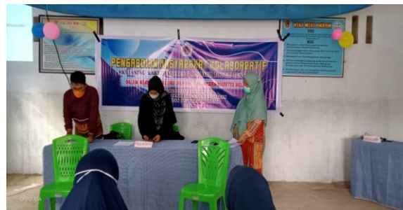
Gambar 2. Persiapan materi pengabdian

Pelayanan Terpadu PKM Kota Selatan Kota Gorontalo.