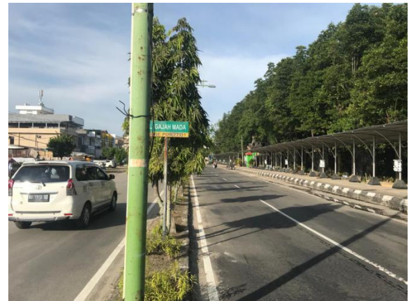
Gambar 4. Ujung Jalan Gajah Mada