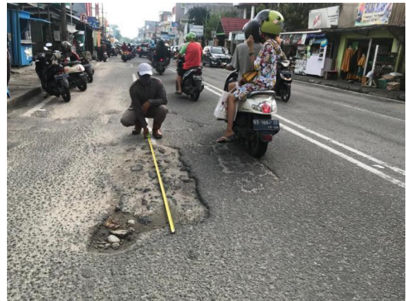
Gambar 6. Kerusakan Lubang dan Tambalan

lubang sebanyak 43 buah atau titik total luas sebesar 349,56 m 2 atau hampir sebesar 5,38% dari luasan permukaan ruas jalan sisi kirinya. Retak tambalan terdapat pada 18 titik, dengan luasan sebesar 314,80 m 2 (4,85% dari luasan segmen jalan sisi kiri). Sedangkan pada sisi kanannya juga terdapat retak lubang pada 44 titik dengan luasan total sebesar 284,26 m 2 atau sebesar 4,38% dari luasan sisi jalannya.