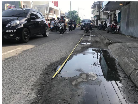
Gambar 8. Kerusakan Retak Pinggir (Sumber: Survei Lapangan, 2020)

Pada kedua sisi jalan yang disurvei, terdapat juga kerusakan retak pinggir memanjang pada beberapa titik disertai amblas pada sisi luar badan jalan dan pelepasan butir.