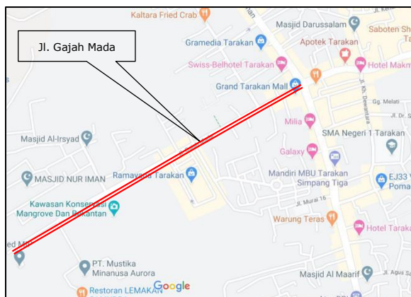
Gambar 3. Lokasi Jalan Gajah Mada

Jalan Gajah Mada ini dengan pangkal jalan berada pada perempatan jalan nasional dan ujung jalan terhubung dengan area Pelabuhan Tengku 2 seperti ditunjukkan pada Gambar 3 dan Gambar 4.