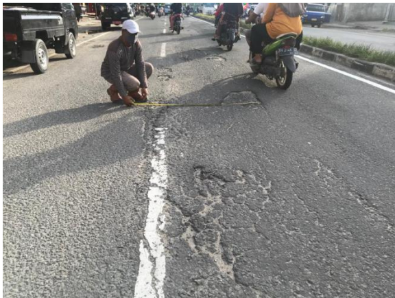
Gambar 5. Kerusakan Retak Kulit Buaya, Retak Memanjang, Retak Acak

Kerusakan retak kulit buaya, memanjang, melintang dan retak acak merupakan jenis kerusakan yang banyak ditemui pada kedua sisi sepanjang ruas jalan.