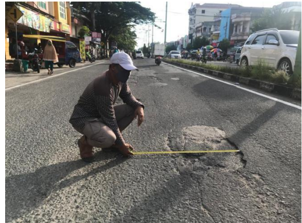
Gambar 9. Kerusakan Amblas, Alur

mencapai 5,97% dari total luasan segmen jalan atau seluas 388,14 m 2 .