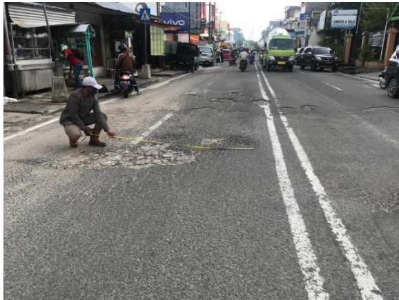
Gambar 7. Kerusakan Pelepasan Butir, Kegemukan, dan Pemisahan Agregat

Pada kedua sisi jalan yang disurvei, terdapat juga kerusakan retak pinggir memanjang pada beberapa titik disertai amblas pada sisi luar badan jalan dan pelepasan butir.