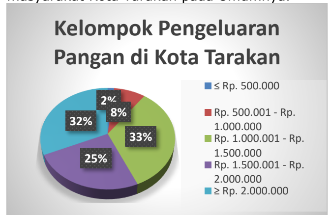
Gambar 1. Diagram Pie Kelompok Pengeluaran Pangan Kota Tarakan 2020

pengeluaran yang digunakan untuk memenuhi kebutuhan makanan sebesar 593.450 rupiah. Rata rata pengeluaran masyarakat Kalimantan Utara adalah Rp. 1.565.255 dengan besaran pengeluaran pangan yaitu Rp. 804.422 dan pengeluaran non pangan Rp. 760.834. Hal ini mengindikasikan pada umumnya masyarakat Kalimantan Utara pangsa pengeluaran pangan lebih tinggi dibandingkan non pangan. Berdasarkan hasil penelitian yang terangkum pada gambar 2. masyarakat kota Tarakan juga memiliki kecenderungan pengeluaran pangan yang tinggi yaitu 33% pada kelompok pengeluaran pangan Rp. 1.000.000-Rp. 1.500.000 lebih tinggi dibandingkan rata-rata pengeluaran pangan masyarakat Kalimantan Utara berdasarkan data SUSENAS. Tingginya pengeluaran akan pangan di Kota Tarakan, menjadi salah satu indikator akan ketahanan pangan dan diersifikasi pangan yang dikonsumsi masyarakat Kota Tarakan pada Umumnya.