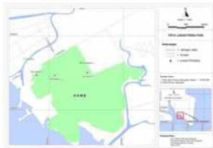
Gambar 1. Peta lokasi penelitian

Penelitian ini dilaksanakan pada bulan Desember 2016 sampai dengan bulan Maret 2017. Lokasi penelitian dilakukan di Kawasan Konservasi Mangrove dan Bekantan (KKMB) Kota Tarakan. Analisis sampel bahan organik Nitrogen (N), dan Fosfor (P) dilakukan di Laboratorium Tanah Fakultas Pertanian Universitas Borneo Tarakan. Peta lokasi penelitian disajikan pada Gambar 1.