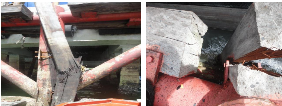
Gambar. 1 Kerusakan pelindung face fender jetty No. 1

Permasalahan yang dihadapi adalah terjadinya kerusakan pada struktur face fender yakni kerusakan kayu pelindung face fender akibat tertabrak kapal tanker saat bersandar (Sulardi, 2016 dan Sulardi 2016a). Kayu pelindung face fender menggunakan material balok kayu ulin dengan ukuran 20x20 Cm dengan kondisi putus dan terbelah sebagaimana tersaji pada Gambar 1 . Dengan kondisi seperti ini maka dinyatakan bahwa struktur fender jetty no.1 pada kondisi sub standard, unsafe condition dan tidak layak dioperasikan.