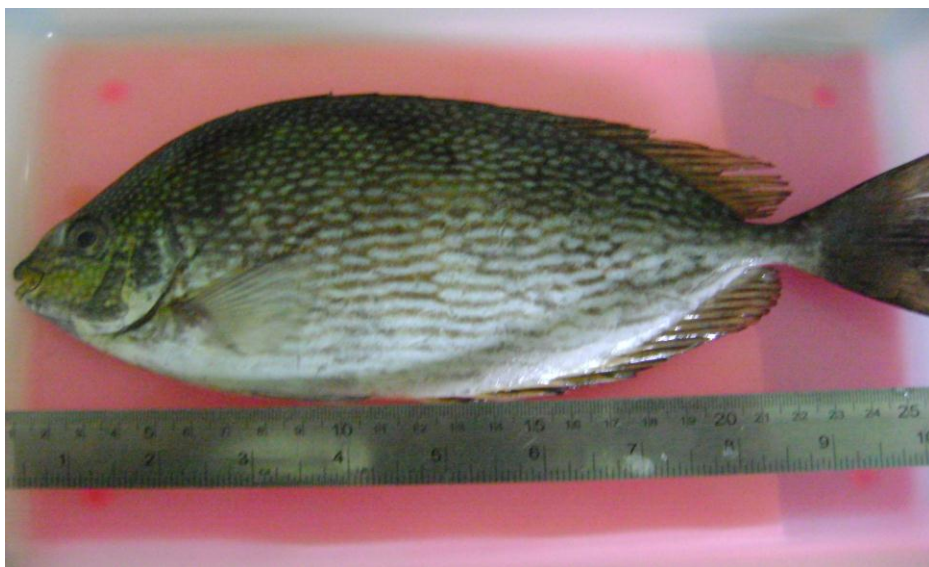
Gambar 1. Ikan Beronang Tulis ( Siganus javus ) (Salim dan Firdaus, 2013)

Penelitian ini diharapkan memberikan manfaat serta informasi mengenai mortalitas dan rasio kelamin dari ikan beronang tulis ( Siganus javus ) di perairan Kota Tarakan.