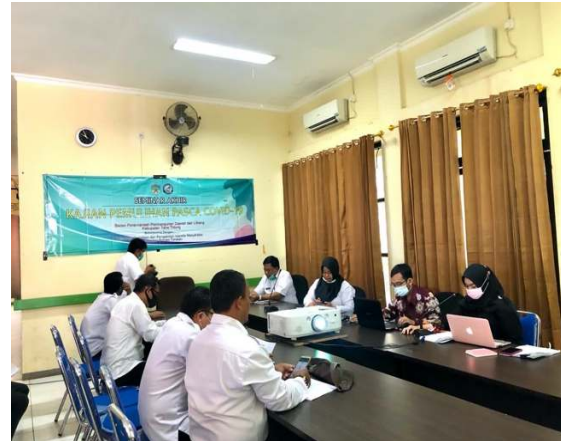
Gambar 6. Tim Pengabdian Melakukan Presentasi Identifikasi Inisiatif-Inisiatif Pasca COVID-19 Di Kabupaten Tana Tidung