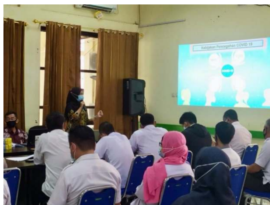
Gambar 5. Tim Pengabdian Melaksanakan Presentasi Identifikasi dan Analisis Dampak Kebijakan

3.3 Mengidentifikasi inisiatif-inisiatif dan strategi baru yang di munculkan pasca COVID-19 DI Kabupaten Tana Tidung. Inisiatif-inisiatif dan strategi baru ini didapatkan dengan menggunakan Teknik Analisis SWOT. Analisis ini didasarkan pada logika yang dapat memaksimalkan kekuatan ( strength ) dan peluang ( opportunity ), namun secara bersamaan dapat meminimalkan kelemahan ( weakness ) dan ancaman ( threat ) (Start & Hovland, 2011). Hal ini disebut dengan analisis situasi. Setelah mendapatkan kumpulan informasi data selanjutnya diperlukan analisis SWOT menggunakan matriks SWOT.