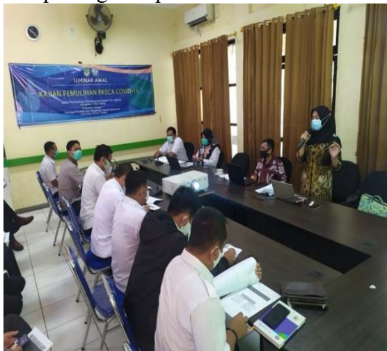
Gambar 4. Tim Pengabdian Melakukan Presentasi Identifikasi dan Analisis Dampak COVID-19

3.1 Mengidentifikasi dan menganalisis dampak COVID-19 terhadap cara kerja dan tata Kelola layanan. Dalam hal ini dampak COVID-19 terhadap aspek-aspek yaitu aspek Kesehatan, sosial, dan ekonomi. Identifikasi dampak tersebut merupakan Langkah pertama yang kami lakukan untuk mengetahui dampak apa saja yang terjadi di msayarakat Kabupaten Tana Tidung selama masa pandemic COVID-19. Penjabaran dari setiap aspek tersebut memberikan gambaran dalam jumlah angka dan grafik sehingga hal ini menjadi indicator pengajuan advokasi kepada pemerintah untuk mendapatkan startegi -strategi baru dalam penanganan pasca COVID-19.