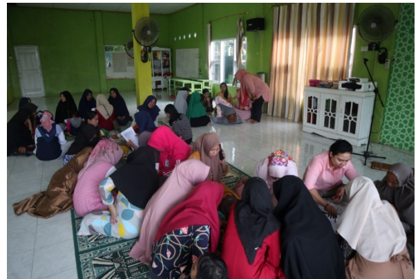
Gambar 2 : Kegiatan Diskusi