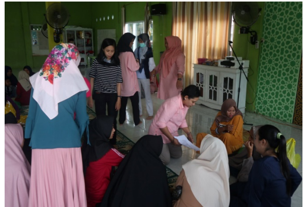
Gambar 1: Kegiatan penyuluhan

dalam melakukan identifikasi dini terkait masalah ISPA hingga melakukan pencegahan-pencegahan penularan penyakit, aksi-aksi untuk menunjang Kesehatan masyarakat terutama pada balita yang saat ini masih tinggi angka kejadiannya.