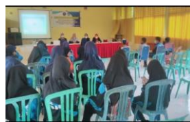
Gambar 2. Sesi diskusi dan tanya jawab

Kemudian setelah selesai memberikan penjelasan tentang pentingnya Pencatatan Identifikasi kesehatan dan rekam kesehatan personal siswa, kami di persilahkan mengunjungi UKS SMPN 7 Baubau, yang di dampingi oleh pembina