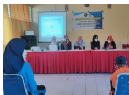
Gambar 1. Pemberian materi

Pengabdian masyarakat ini dilaksanakan di SMPN 7 baubau Tentang pentingnya Pencatatan Identifikasi kesehatan dan rekam kesehatan personal siswa yang di laksanakan pada hari Sabtu 1 April 2022 pukul 09.00 – Selesai yang bertempat di Aulah SMPN 7 Baubau yang diikuti oleh 30 siswa. Proses pelaksan pengabdian ini dengan metode cerama yang di jelaskan oleh dosen-dosen Rekam medis dan informasi keseahtan Politeknik Baubau yang menjelasak tentang pentingnya pencatatan, identifikasi kesehatan, dan rekam kesehatan personal siswa mulai dari definisi, manfaat dan kegunaan, ruang lingkup, isi tata cara penyelenggaraan, dll. Kemudian dilanjutkan dengan sesi diskusi dan tanya jawab siswa-siswa yang terlihat pada gambar 1 dan gambar 2.