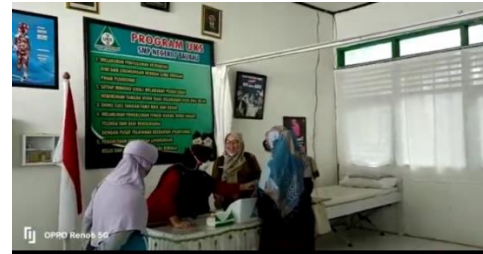
Gambar 3. Kunjungan ruangan UKS SMPN 7 Baubau

UKS untuk melihat ruangan UKS dan menjelaskan isi dari ruangan UKS SMPN 7 Baubau seperti terlihat pada gambar 3. Dan di rangkain penjelsan tetang boklet rekam kesehatan siswa yang terlihat seperti gambar 4 dan cara pengisiannya serta kegunaannya