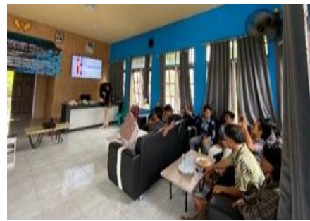
Gambar 1. Sosialisasi Penyampaian Materi Stunting dan Gemarikan Di Desa Sengkong

Kegiatan pengabdian masyarakat ini dilaksanakan dalam bentuk penyuluhan tentang program pencegahan stunting pada bayi dan balita. Semua orang tua dari bayi dan balita di Desa Sengkong merupakan peserta dalam kegiatan pengabdian masyarakat ini. Kegiatan ini dilaksanakan pada hari Jum'at, 19 Januari 2024 yang dilaksanakan pukul 14.00 WITA sampai selesai. Tempat pelaksanaan kegiatan di aula kantor desa Sengkong yang dihadiri oleh ibu-ibu dan anak-anak dari bayi hingga balita. Dalam kegiatan penyuluhan ini, para peserta diberikan penyuluhan berupa program- program pencegahan stunting pada bayi dan balita serta edukasi dan membagi-bagikan makanan pendamping ASI seperti terlihat pada Gambar 1.