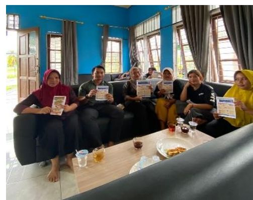
Gambar 3. Pembagian Poster Stunting dan Gemar Ikan