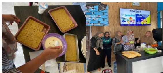
Gambar 5. Pengolahan dan pembuatan makanan protein nugget ikan

Gambar 5 merupakan proses pembuatan makanan yang kaya protein. Makanan berprotein yang kaya akan nutrisi, kandungan mikronutrien, dan omega 3. Dari kandungan protein tersebut maka dipilihlah salah satu olahan makanan yakni nugget ikan. Ikan yang diolah yakni ikan bandeng yang telah dihaluskan lalu dicampur dengan bahan dapur lainnya sehingga menarik untuk dikonsumsi baik anak-anak maupun ibu-ibu.