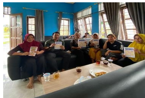
Gambar 3. Pembagian Poster Stunting dan Gemar Ikan