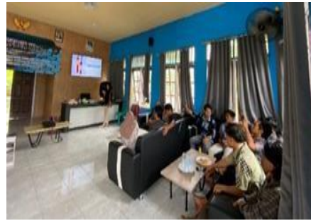
Gambar 1. Sosialisasi Penyampaian Materi Stunting dan Gemarikan Di Desa Sengkong

Kegiatan pengabdian masyarakat ini dilaksanakan dalam bentuk penyuluhan tentang program pencegahan stunting pada bayi dan balita. Semua orang tua dari bayi dan balita di Desa Sengkong merupakan peserta dalam kegiatan pengabdian masyarakat ini. Kegiatan ini dilaksanakan pada hari Jum'at, 19 Januari 2024 yang dilaksanakan pukul 14.00 WITA sampai selesai. Tempat pelaksanaan kegiatan di aula kantor desa Sengkong yang dihadiri oleh ibu-ibu dan anak-anak dari bayi hingga balita. Dalam kegiatan penyuluhan ini, para peserta diberikan penyuluhan berupa program- program pencegahan stunting pada bayi dan balita serta edukasi dan membagi-bagikan makanan pendamping ASI seperti terlihat pada Gambar 1.