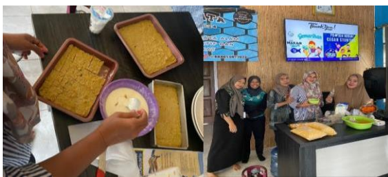
Gambar 5. Pengolahan dan pembuatan makanan protein nugget ikan

Gambar 5 merupakan proses pembuatan makanan yang kaya protein. Makanan berprotein yang kaya akan nutrisi, kandungan mikronutrien, dan omega 3. Dari kandungan protein tersebut maka dipilihlah salah satu olahan makanan yakni nugget ikan. Ikan yang diolah yakni ikan bandeng yang telah dihaluskan lalu dicampur dengan bahan dapur lainnya sehingga menarik untuk dikonsumsi baik anak-anak maupun ibu-ibu.