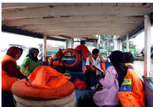
Gambar 3. Perjalanan Sungai Menuju Desa Loa Kumbar