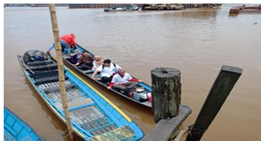
Gambar 4. Perjalanan Menuju Desa Loa Kumbar Menggunakan Kapal Kecil