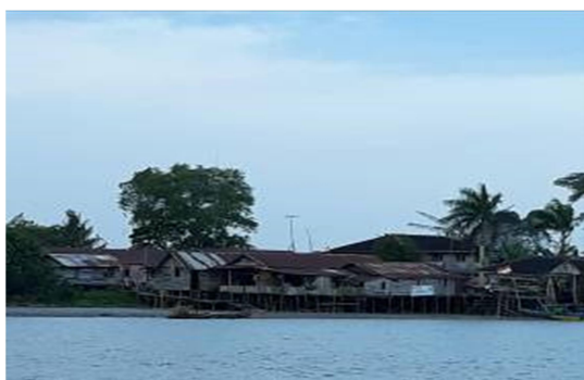
Gambar 2. Tampak Depan Desa Loa Kumbar di Tepi Sungai Mahakam