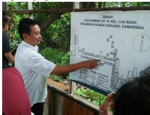
Gambar 9. Denah Desa Loa Kumbang

Diskusi dengan tokoh masyarakat, mulai dari Desa Loa Kumbang hingga Kecamatan Sungai Kunjang, mengenai faktor-faktor dari masyarakat dan lingkungan geografis yang dapat menghambat dan mendorong upaya kesehatan berbasis masyarakat terkait PTM termasuk optimalisasi Posbindu PTM. Gambar 9 menunjukkan peta Desa Loa Kumbang dan Gambar 10 adalah aula Desa Loa Kumbang tempat pelaksanaan kegiatan program.