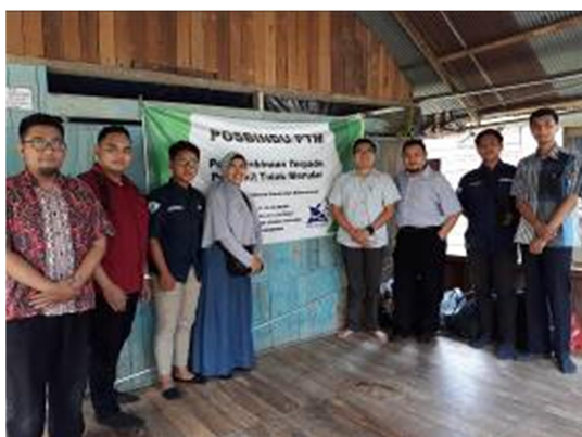
Gambar 8. Mahasiswa Fakultas Kedokteran Universitas Mulawarman di Depan Posbindu PTM Desa Loa Kumbang