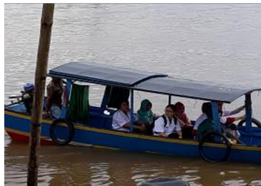
Gambar 5. Perjalanan Menuju Desa Loa Kumbar Menggunakan Kapal Sedang