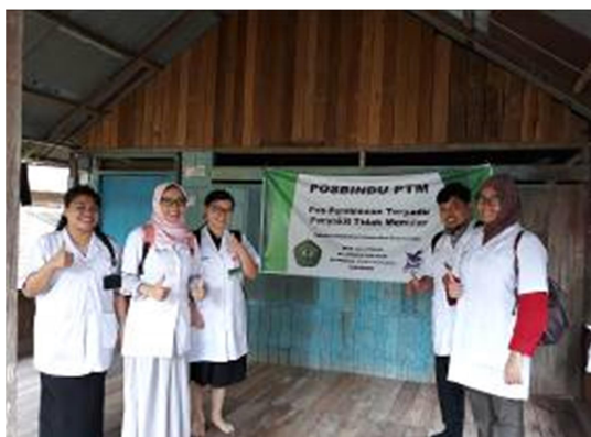
Gambar 7. Dokter Muda Fakultas Kedokteran Universitas Mulawarman di Depan Posbindu PTM Desa Loa Kumbang

dilaksanakan secara terpadu, rutin, dan periodik. Faktor risiko penyakit tidak menular (PTM) meliputi merokok, konsumsi minuman beralkohol, pola makan tidak sehat, kurang aktifitas fisik, obesitas, stres, hipertensi, hiperglikemi, hiperkolesterol serta menindak lanjuti secara dini faktor risiko yang ditemukan melalui konseling kesehatan dan segera merujuk ke fasilitas pelayanan kesehatan dasar (Kemenkes RI, 2012). Gambar 7 dan 8 menunjukkan Posbindu PTM di Desa Loa Kumbang.