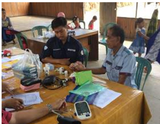
Gambar 11. Pelaksanaan Posbindu PTM di Desa Loa Kumbar

KIE (Komunikasi, Informasi dan Edukasi) yang memadai, seperti serial buku pintar kader, lembar balik, leaflet, brosur, model makanan ( food model ) dan lainnya. Gambar 11 hingga Gambar 14 menunjukkan kegiatan Posbindu PTM di Desa Loa Kumbar.