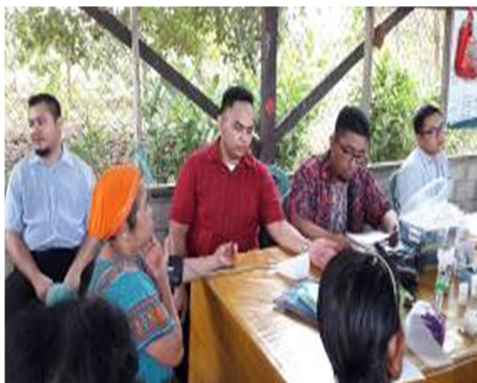
Gambar 13. Pemeriksaan Tekanan Darah