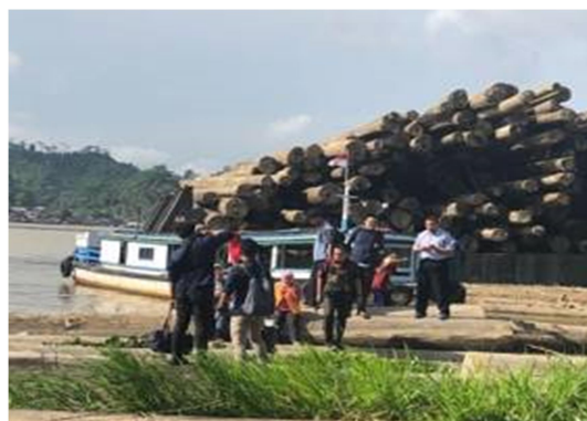
Gambar 6. Kapal Menuju Desa Loa Kumbar Berlabuh di Batang Kayu