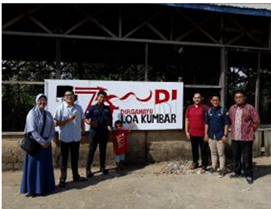
Gambar 10. Aula Desa Loa Kumbar