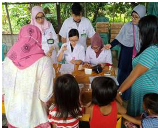
Gambar 14. Pelaksanaan Kegiatan Posbindu PTM di Desa Loa Kumbar