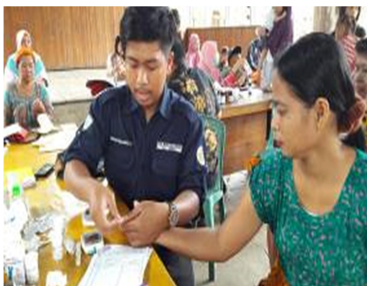
Gambar 12. Pemeriksaan Kadar Gula Darah Sewaktu