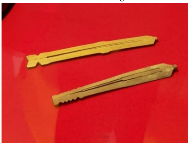
Gambar 1. Alat Musik Rinding/Knobe Oh

mengetahui alat musik rinding dan kekayaan budaya Indonesia. Menurut Pak Jefri Kunci Utama agar anak muda dapat melestarikan budayanya yaitu dengan cari mencintai budayanya karena kalau ada rasa cinta pasti budayanya tidak akan hilang.