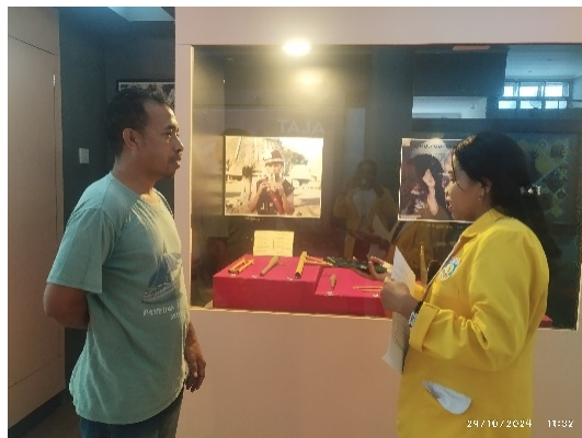
Gambar 4. Dokumentasi Bersama Narasumber