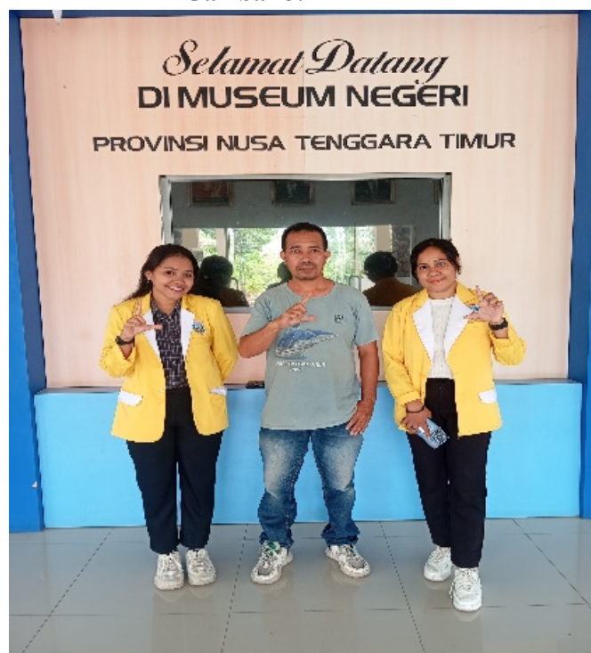
Gambar 3. Wawancara

Menyulam Nusantara: Eksplorasi Alat Musik Rinding/Knobe Oh Kabupaten Tts Pada Pembelajaran Bahasa Indonesia