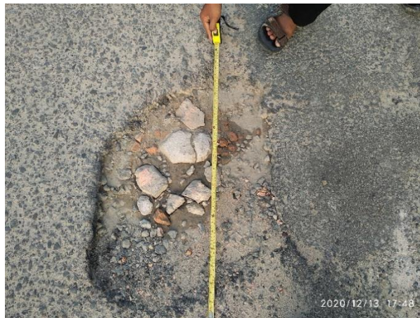
Gambar 3. Kerusakan lubang

Selanjutnya Pada sisi kanan ruas Jalan Kenanga terdapat lubang sebanyak 10 buah atau titik total luas sebesar 78.01 m 2 atau hampir sebesar 4.62 % dari luasan permukaan ruas jalan sisi kanannya. Sedangkan sisi kiri terdapat Lubang sebanyak 11 buah atau titik dengan total luas sebesar 15.65 m 2 atau hampir sebesar 0.93 % dari luasan ruas jalan kirinya.