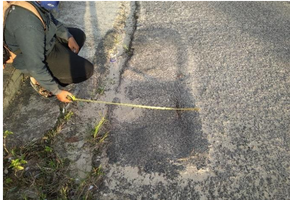
Gambar 2. Kerusakan tambalan

Selanjutnya Pada sisi kanan ruas Jalan Kenanga terdapat lubang sebanyak 10 buah atau titik total luas sebesar 78.01 m 2 atau hampir sebesar 4.62 % dari luasan permukaan ruas jalan sisi kanannya. Sedangkan sisi kiri terdapat Lubang sebanyak 11 buah atau titik dengan total luas sebesar 15.65 m 2 atau hampir sebesar 0.93 % dari luasan ruas jalan kirinya.