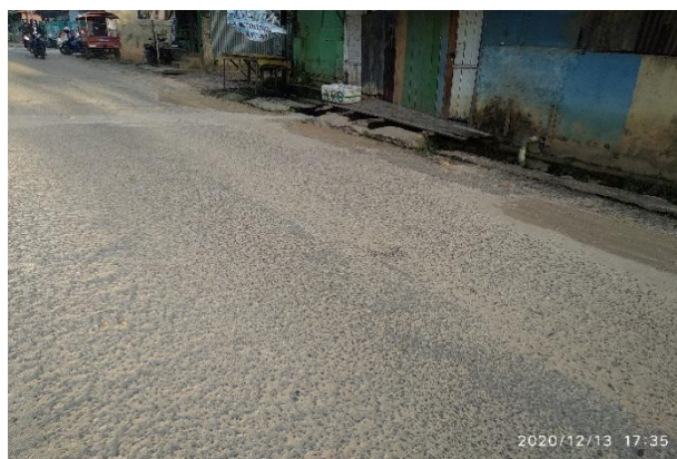
Gambar 4. Kerusakan pengausan agregat

Pengausan agregat dengan luasan sebesar 140,00 m 2 (8.30% dari luasan segmen jalan sisi kanan). Sedangkan pada sisi kirinya juga terdapat pengausan agregat dengan luasan total sebesar 175.50 m 2 atau sebesar 10.40% dari luasan sisi jalannya.