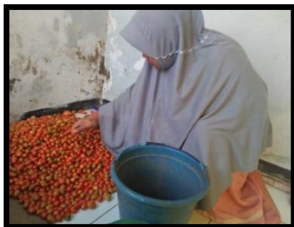
Gambar 8. Penyortiran Tomat Cherry

Proses penyortiran adalah kegiatan memisahkan tomat cheery yang berukuran sedang dan kecil dan tomat cherry yang rusak akibat terserang hama ataupun penyakit. Tujuan dari proses penyortiran untuk memastikan bahwa tanaman tomat cherry yang akan dipasarkan tersebut harus berkualitas baik dan memenuhi kriteria.