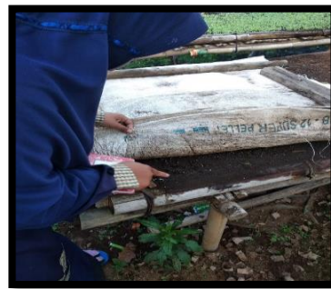
Gambar 1. Penyemaian Benih Tomat Cherry

Penyemaian dilakukan dengan cara benih disebar pada tempat yang telah diberikan pupuk, setelah itu di tutup dengan menggunakan karung yang bertujuan agar kondisi tempat semai tersebut selalu lembab, lalu didiamkan selama 10 hari. Setelah itu, bibit yang berumur 10 hari tersebut dipindahkan ke x tray yang merupakan wadah semai yang terbuat dari daun pisang yang kering yang telah diberikan pupuk. Bibit dipindahkan dan didiamkan selama 1 bulan hingga menjadi bibit yang sudah memiliki morfologi yang lengkap dan mampu bertahan ketika berada di lahan.