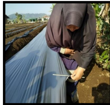
Gambar 5. Pemasangan Mulsa Tanaman Tomat Cherry