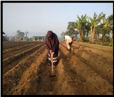
Gambar 3. Pembuatan Bedengan Tanaman Tomat Cherry

Dalam pembuatan bedengan tanah dicangkul dengan kedalaman 40-50 cm kemudian dibentuk bedengan dengan lebar 100 cm, tinggi bedengan 35 cm, panjang bedengan 90 m dan jarak antar bedengan yaitu 20cm. Pembuatan bedengan bertujuan untuk menghindari lahan dari genangan air ketika lahan di guyur oleh air hujan dan untuk mempermudah dalam pengendalian gulma.