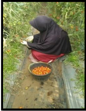
Gambar 7. Panen Tomat Cherry