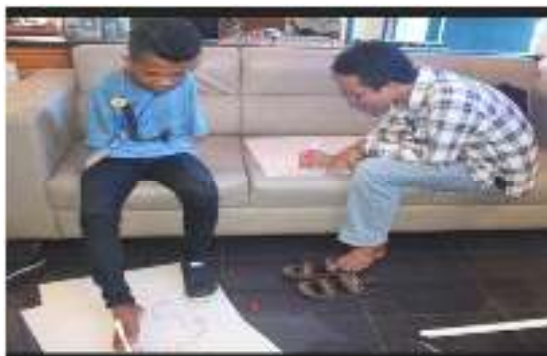
Gambar 3. Membuar Cerita