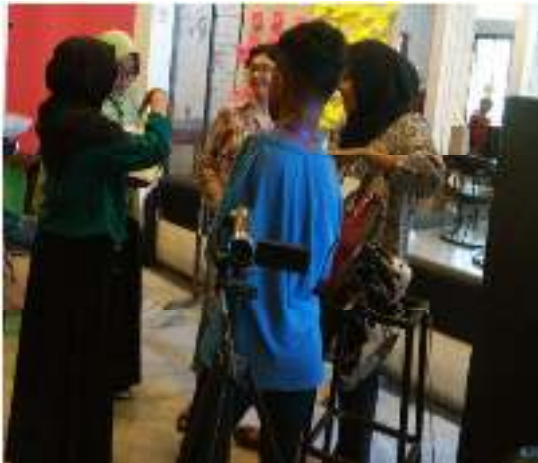
Gambar 1. Permainan Perkenalan