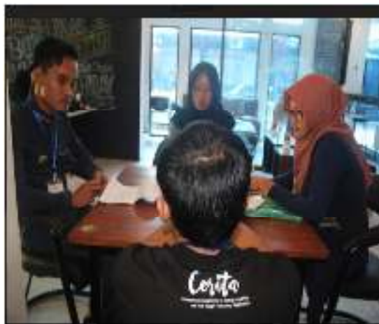
Gambar 2. Dialog Perbedaan