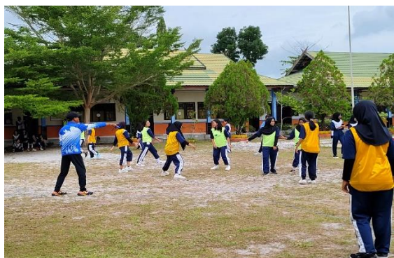
Gambar 6. Pelatihan Hadang