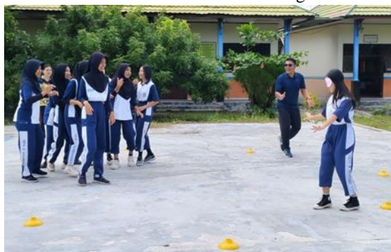
Gambar 7. Pelatihan Hadang