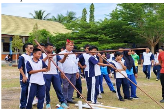
Gambar 5. Pelatihan Menyipet