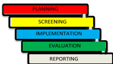
Gambar 1. Metode Pelaksanaan Pengabdian

Metode yang diterapkan pada program gerakan masyarakat hidup sehat melalui permainan tradisional berbasis kearifan lokal masyarakat Dayak di Kelurahan Banturung menggunakan sosialisasi dan demonstrasi, sedangkan prosedur pelaksanaan pengabdian masyarakat terdiri dari planning, screening, implementation, evaluation dan reporting .